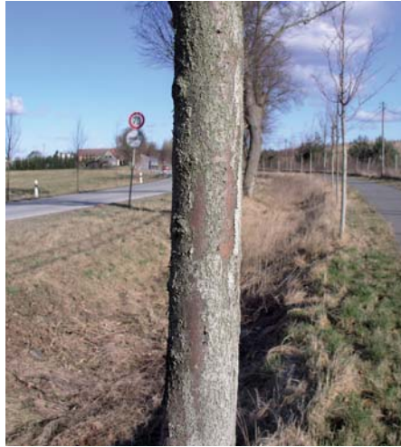
Abb. 8: Wird die Baumfarbe ohne eine Vorbehandlung aufgetragen, blättert die Farbe eher ab.