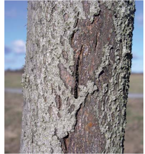
Abb. 9: Ist die Rinde durch gelöste Farbbeläge ungeschützt können genau hier Schäden an Baum entstehen (subletale Rindenrisse).

wurde. Wurde bei Linde auf die Reinigung oder die Grundierung des Stammes verzichtet, resultierten hieraus erhebliche Belagschäden (Abb. 8). Die Baumfarbe ohne Quarzsand zeigte nach fünf Jahren geringfügig größere Schäden als die Variante mit Quarzsand.