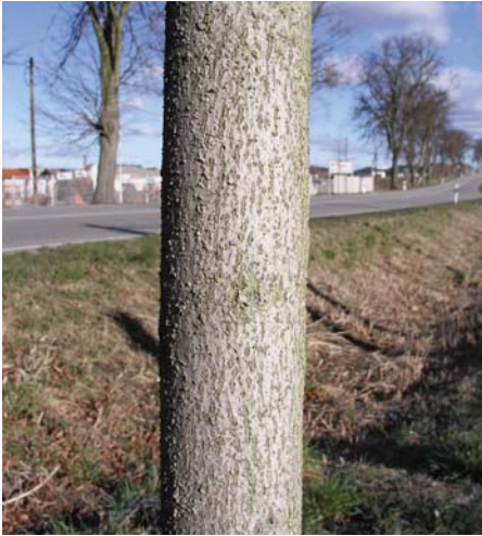
Abb. 7: Feste Haftung der Baumfarbe ist sowohl bei Linde (Foto) als auch bei Eiche gegeben, wenn vorher grundiert und gereinigt wird.