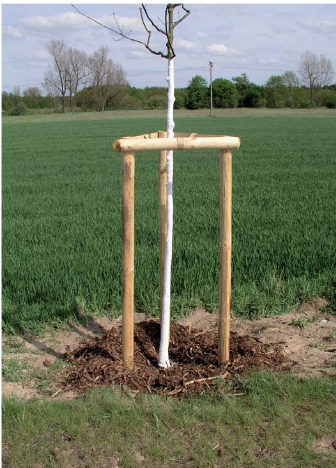
Abb. 1: Frisch gestrichener Baum an einer Landstraße.

Abschließend wurden die Stämme mit Baumfarbe bis zum Kronenansatz gestrichen.