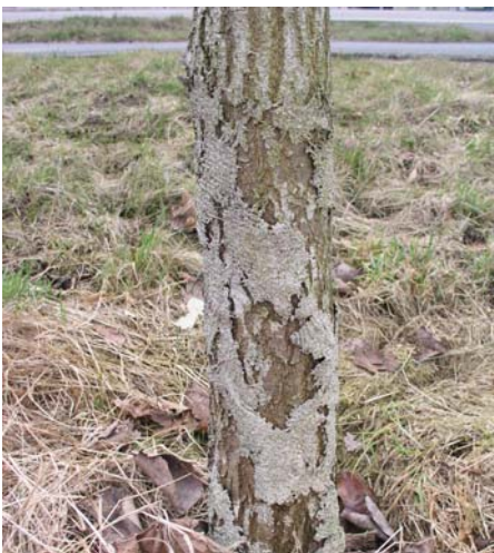
Abb. 10: Nach fünf Jahren lösen sich die Jute-Wickel deutlich ab und stellen nur noch einen bedingten Schutz dar.