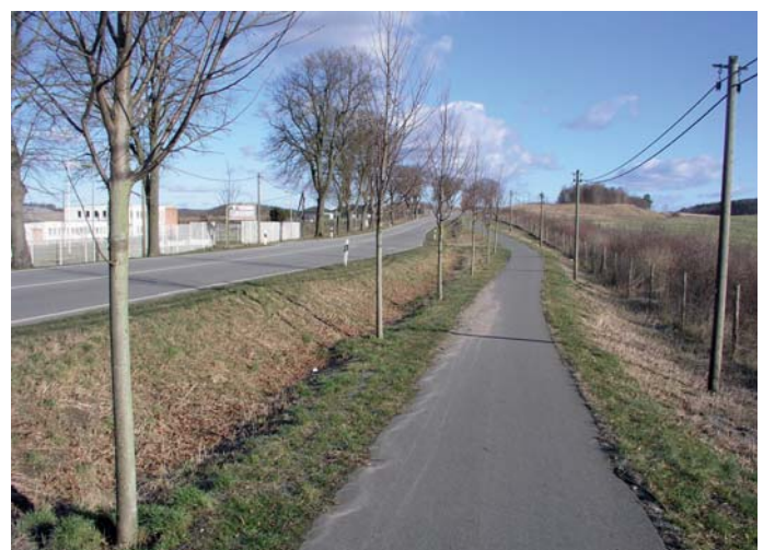
Abb. 6: Nach fünf Jahren fallen die Stammanstriche Eiche und Linde (Foto) kaum noch ins Auge.